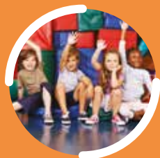
CPJEPS Animateur d'activités et de vie quotidienne