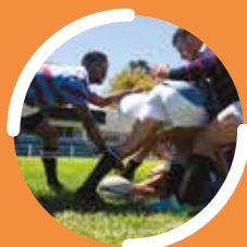
DE JEPS Perfectionnement sportif