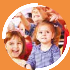
BP JEPS Animateur loisirs tous publics