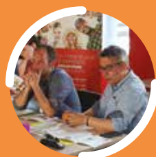
DESJEPS Direction de Structure et de Projet